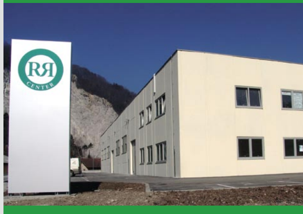
Nasipi, 1420 Trbovlje