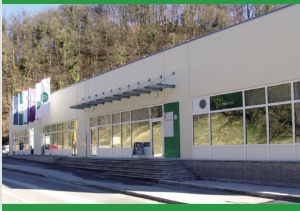
Cesta 1. maja 83, 1430 Hrastnik