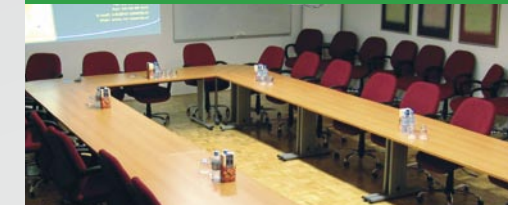
Velika sejna soba